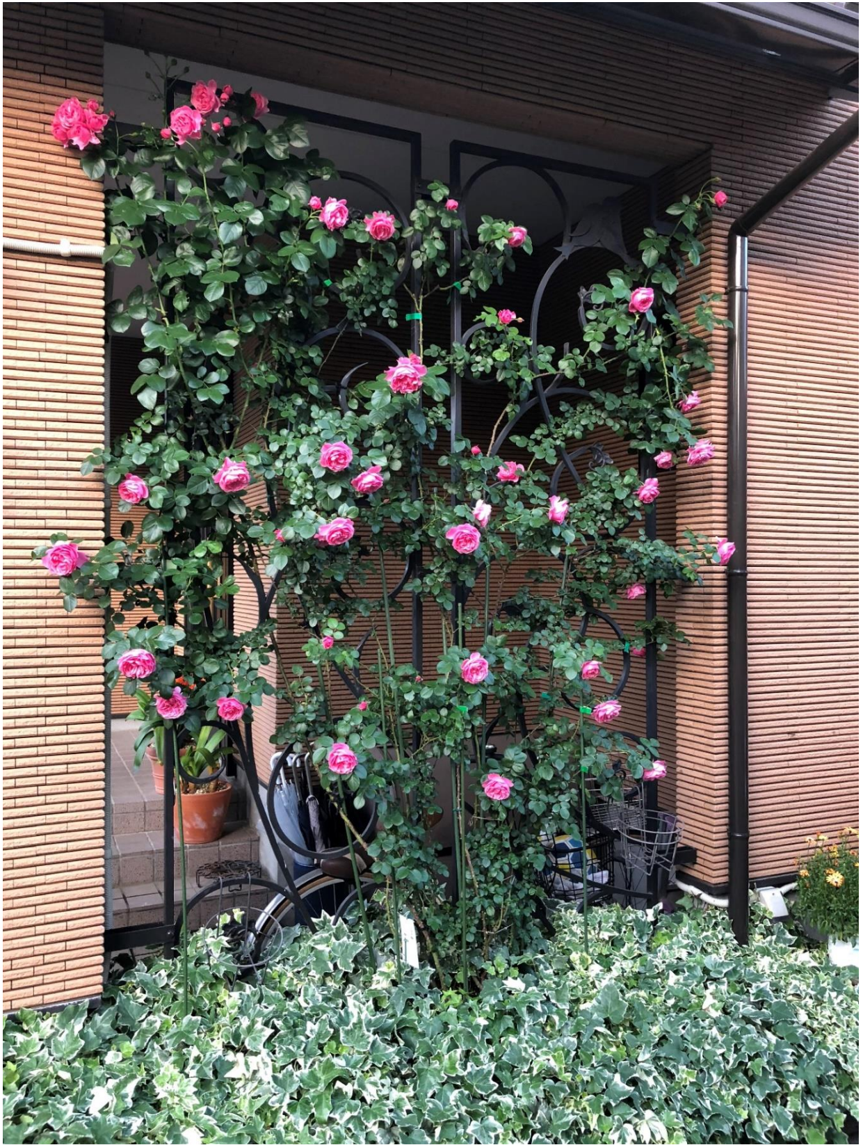
美しいバラが屋根までいっぱい玄関を飾っています